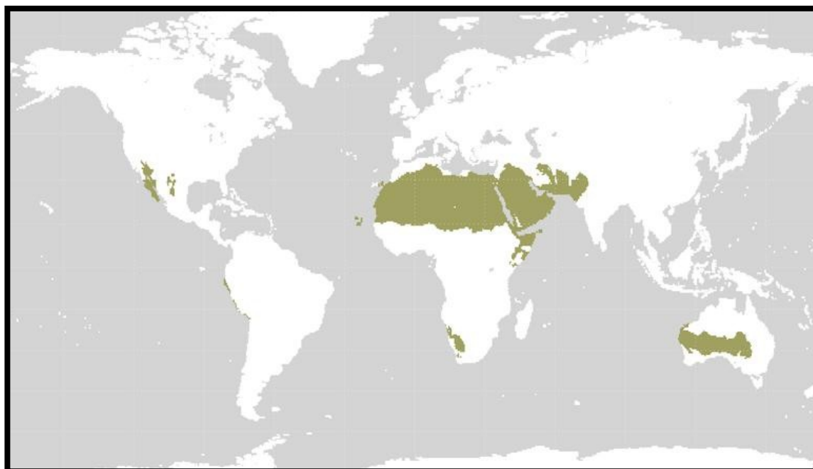
Figura este o hartă pe care sunt reprezentate zonele deșertice.